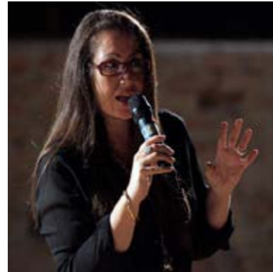
idea e direzione artistica Chiara Giordano

Armonie d'Arte Festival è patrimonio della Fondazione Armonie d'Arte che ne è l'ente attuatore