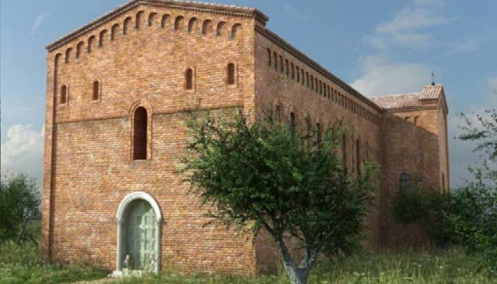
Chiesa abbaziale normanna di Scolacium ricostruzione virtuale commissionata dal Festival